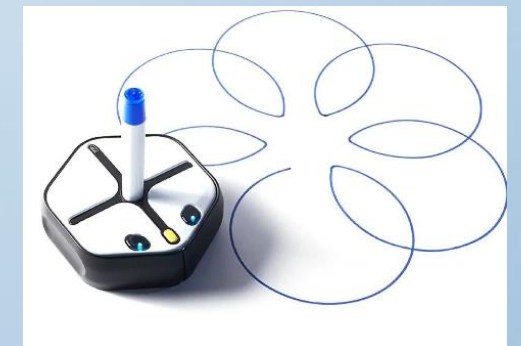
iRobot Education Root r1