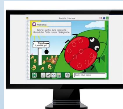
Software Calibri 1,2,3...