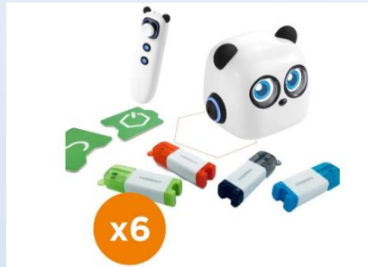
Makeblock - mTiny -6 robot...